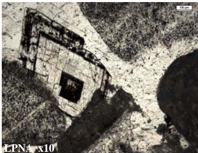
Photo 215 : Cristal automorphe de dolomite qui présente une zonation résultant des différents stades de croissance du minéral. Chacun de ces stades est marqué par un liseré brun à noir dû soit à des impuretés (fer ou matière organique) incorporées au cristal en cours de croissance, soit à une précipitation de fer qui oxydé se transforme en limonite.

Photo 214 : Détail du ciment qui montre la présence de cristaux automorphes rhomboédriques (a), isolés. Ces cristaux présentent une zonation soulignée par des précipitations de fer (c). A la périphérie des cristaux automorphes on note une large frange de croissance syntaxique (b) dont les limites externes sont également soulignées par un liseré de fer (c). Le cristal ainsi constitué (support automorphe losangique + frange de croissance) constitue un seul et même minéral (extinction synchrone en LPA) probablement de dolomite. Remarquez que la structure cristalline est conservée entre (a) et (b) comme en témoigne les stries de clivages (d) parallèles au bord du cristal support rhomboédrique. Il est possible qu'une partie du ciment soit calcitique, il faudrait une coloration pour lever le doute.